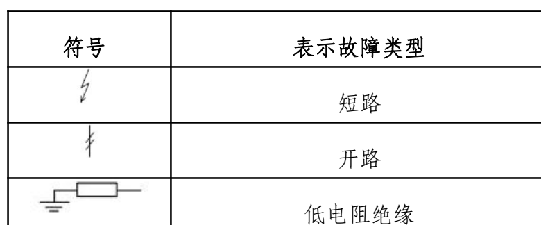
表 2 故障点标注符号对应表

参赛选手根据任务书设置故障现象（包括感应器检测故障、显示器故障、安全回路故障等），在电梯上进行故障排除，记录故障现象、诊断结果及排除方法，并须在图纸上准确的标出故障的具体位置和故障类型方可确认有效，错标无效（故障点对应标注符号见表 2），工作任务完成后须将电梯正常运行后方可得分，否则不能得分。