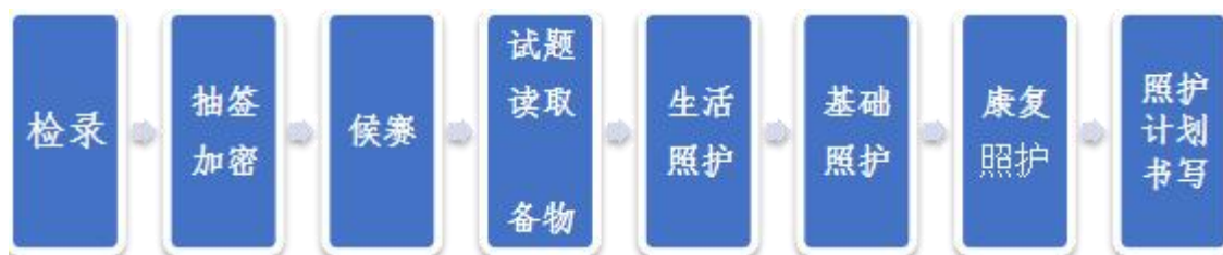
图2 参赛选手竞赛流程图

各参赛选手完成试题读取、备物后，持赛题案例、用物依次进入生活照护、基础照护、康复照护三个赛室，最后进入照护方案书写室。第一天、第二天竞赛流程一致。