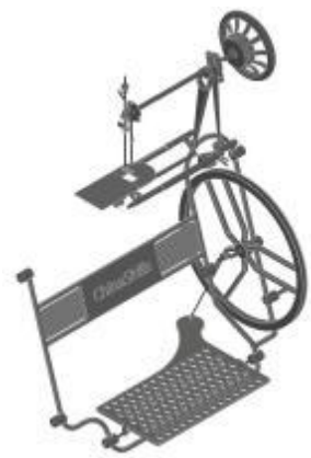
图 1-3 缝纫机