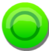
图 3.2.6 按钮图标示意图

当风力系统控制按钮自锁时，开启交流风扇并点亮交流黄灯作为风力系统指示，当风力系统控制按钮解锁时，断开全部控制节点。