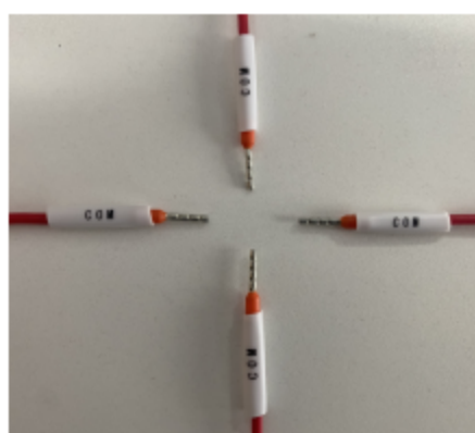
图 3.2.2 号码管标识示朝向及方向意图

号码管标识号按照提供的标识数码有序连接，号码管标识读序合理且正面朝外易于查看。号码管标识示意图如图 3.2.2 所示；要求号码管能遮住 U/OT 型冷压端子的压线钳压痕或遮住管型冷压端子的塑料套管；如图 3.2.3 所示。