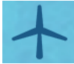
图 3.1.4 风力容量设置

单位面积风力发电系统输出功率： 所选单位面积风力发电系统输出功率，与等效倍率的 1kW 风机功率与风速模型关系如下述表达式：