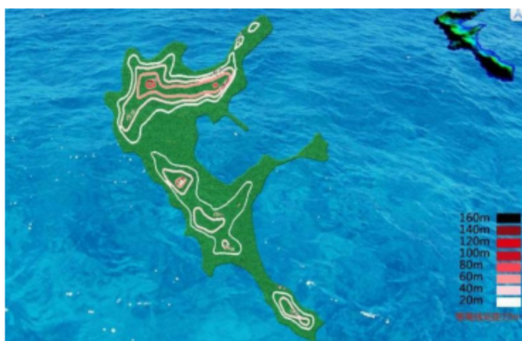
图 3.1.1 岛屿地形图

模型为“山东南城隍岛”“试题1”。方案设计名称为“工位号”，例如方案名称“01”，表示工位号为01的方案设计。岛屿地形图如图3.1.1所示。