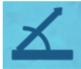
图 3.1.3 最佳倾角设置

光伏组件最佳倾角分析： 在仿真规划软件的“设计详情”中，查询光伏组件最佳日照时长对应的组件倾角，设置方式如图 3.1.3 所示。