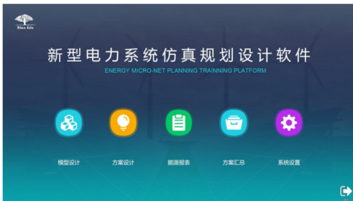
图 2.2.2 新型电力系统仿真规划设计软件界面图