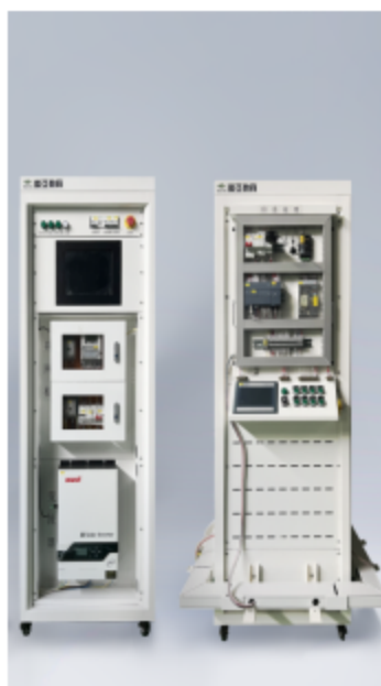
图 2.2.1 新型电力系统综合实训平台硬件外观图

新型电力系统综合实训平台由硬件平台和软件平台两部分组成。硬件方面核心部件采用了行业领先的离网、PCS 为主导的发电系统架构。系统构架中涵括了储能运行管理中心、负载及控制中心。软件平台包括新型电力系统仿真规划设计软件和新型电力系统能源场站仿真运维软件。设备整体功能涵盖新型电力工程的供能、BMS 智能储能、智能调控及负载装置的选型与实施部署以及储能管理、能源综合利用、能源规划、场站运维等应用系统的开发、调试与项目验收检测。