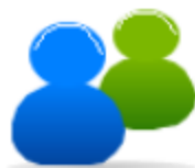
图 3.2.9 一键退出控件

要求使用图 3.2.9 控件制作一键退出控件，可实现能在任何界面（除登录界面外）的一键退出组态软件功能。