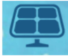
图 3.1.2 光伏容量设置

光伏组件最佳倾角分析： 在仿真规划软件的“设计详情”中，查询光伏组件最佳日照时长对应的组件倾角，设置方式如图 3.1.3 所示。