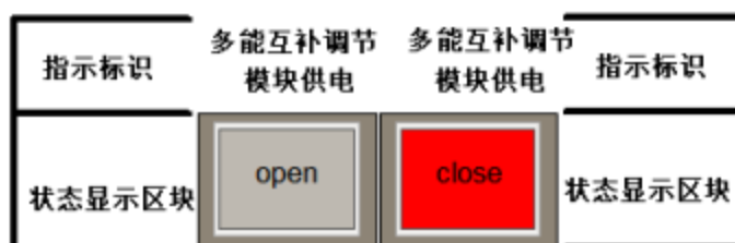
图 3.2.8 组合式开关按键案例

左键单击单个控制节点按钮：按钮显示右图，可控制新型电力系统中所有单个的控制节点。再次左键单击单个控制节点按钮：按钮显示左图，断开该控制节点。