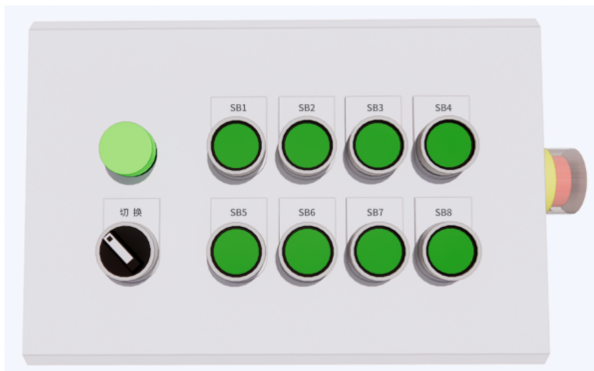
图 3.2.7 手动按钮布局示意图

在站端控制系统中，根据图 3.2.7 手动按钮布局示意图所示，PLC 编程执行对应表 3.2.2 按钮功能。