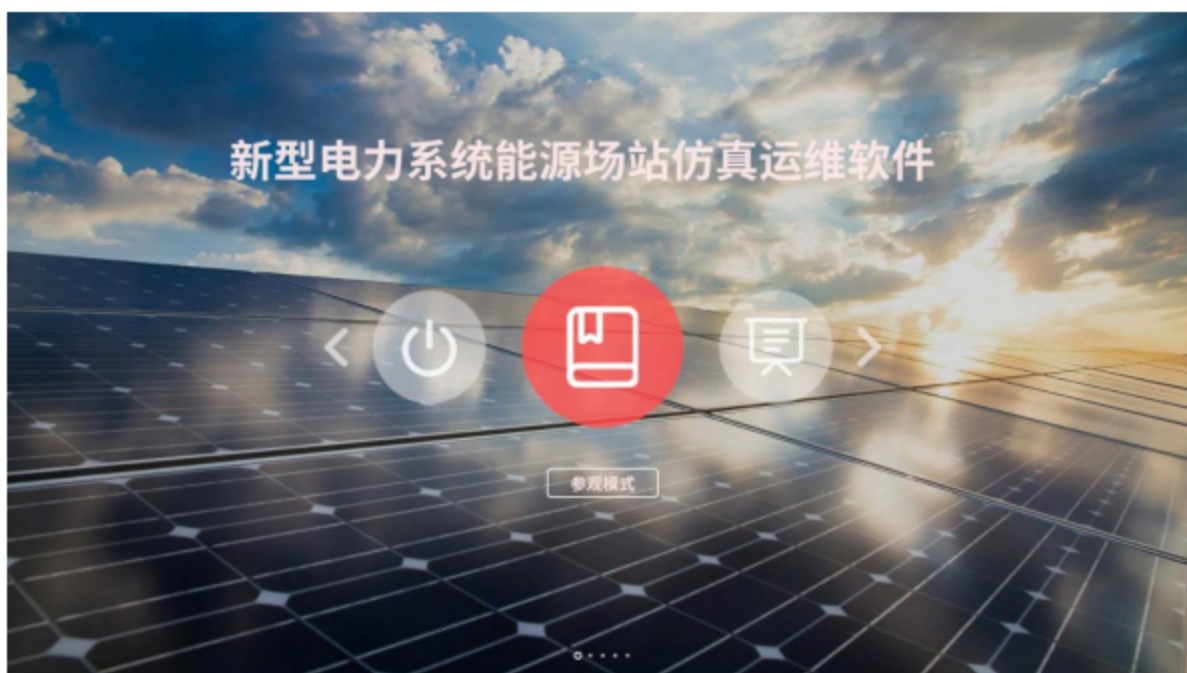
图 2.2.3 新型电力系统能源场站仿真运维软件界面图