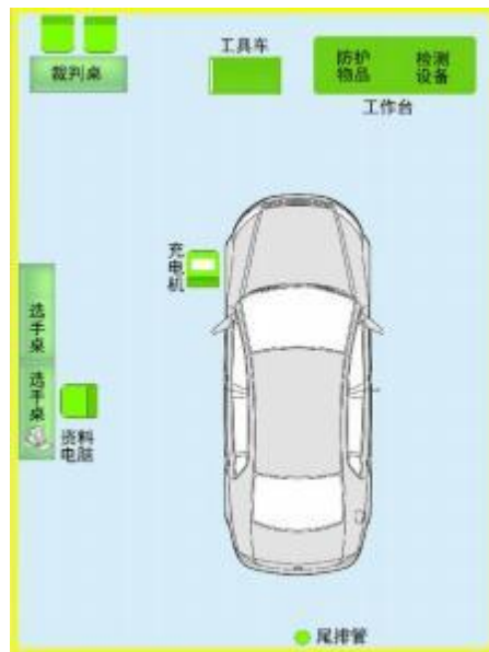
图1整车竞赛工位布置图

各模块共用竞赛场地，赛场总面积不小于800m 2 ，配备8~12个竞赛工位和2个备用工位，比赛工位数根据最后报名选手数量调整。每个工位占地面积不低于50m 2 ，提供220V交流电，插座带漏电保护和接地保护，能承载功率7kw、电流32A以上，配置有举升机、尾排及通风系统；竞赛场地净空高度不低于4.2m，实操竞赛工位布置见图1。