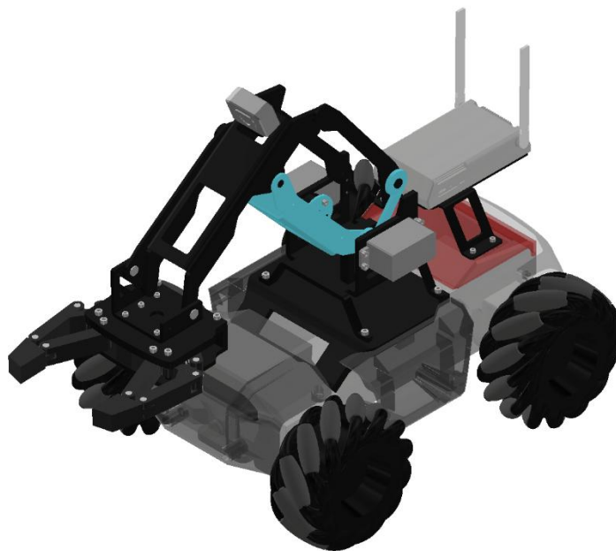
图 1-2 工程车

工程车如图 1-2。请根据“桌面 \ 比赛数据 \ M1 \ 1-2-工业产品设计”提供的图纸，按照表 1-2 指定的零部件完成产品数字模型的建立，未注尺寸可依据装配关系确定。赋予数字化模型合理的材质属性及恰当的外观样式，并进一步设计与制作产品设计表达文件。