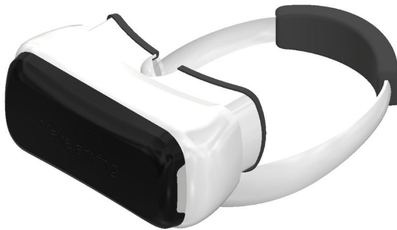
图 1-1 VR 眼镜

VR 眼镜如图 1-1。请根据“桌面 \ 比赛数据 \ M1 \ 1-1-消费产品设计”提供的图纸，按照表 1-1 指定的零部件完成产品数字模型的建立，未注尺寸可依据装配关系确定。赋予数字化模型合理的材质属性及恰当的外观样式，并进一步设计与制作产品设计表达文件。