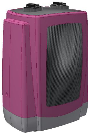
图 1-1 暖风机

暖风机如图 1-1。请根据“桌面 \ 比赛数据 \ M1 \ 1-1-消费产品设计”提供的图纸，按照表 1-1 指定的零部件完成产品数字模型的建立，未注尺寸可依据装配关系确定。赋予数字化模型合理的材质属性及恰当的外观样式，并进一步设计与制作产品设计表达文件。