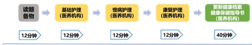
图 1 老年护理与保健场景、模块流程图