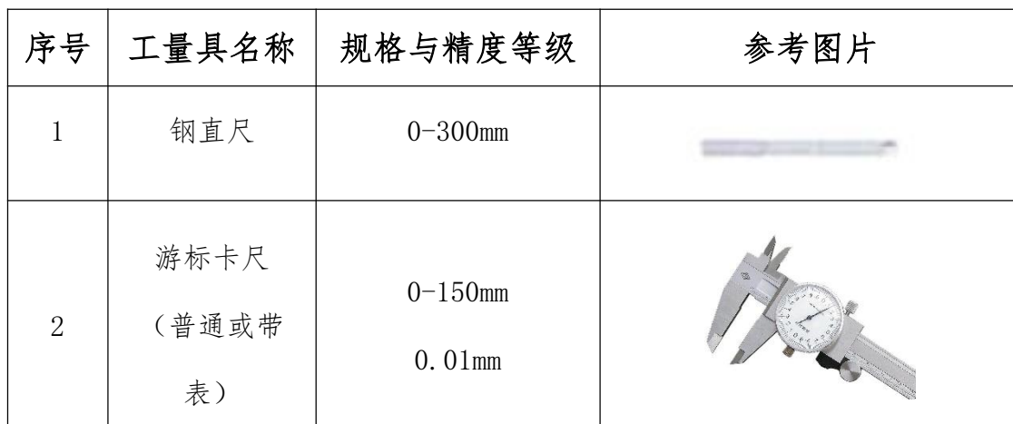
表 5 建议测量工具（自带）清单表

测量工具（自带）：卡尺、千分尺、半径规、米制螺纹规、深度尺、表面比对量块、直尺等。建议（但不限于）清单表 5 如下：